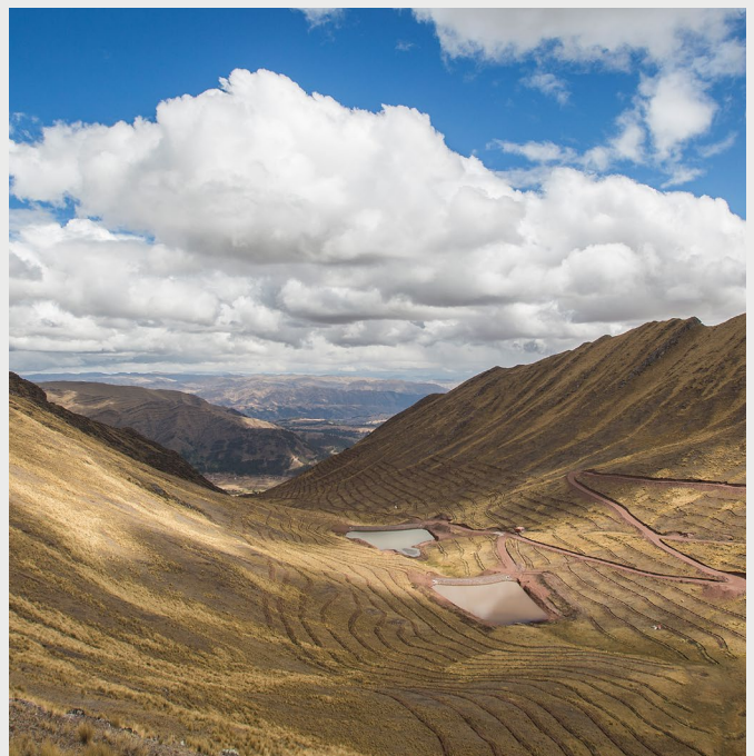
Figura 1. Zanjas de infiltración en la microcuenca Can Can, que abastece a la Laguna Piuray, Cusco, Perú.